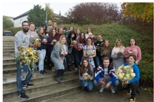
Motivierte Azubis in Hessen-Thüringen