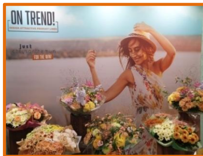
Chrysanthemen-Motive für den Systemhandel