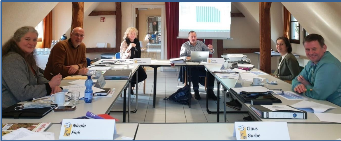
Ausbildungsexperten im FloristPark